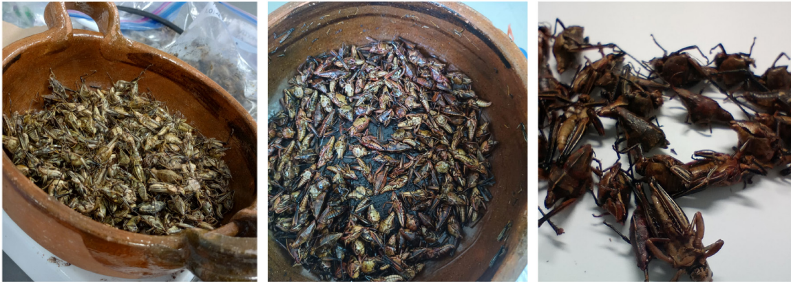
Figura 1. Chapulín procesado de forma tradicional usando una cazuela de barro

Tradicionalmente, los insectos se consumen fritos en aceite o tostados en comal de barro, en algunos casos se les añade ajo, limón y sal, como se muestra en la Figura 1 (Oibiokpa et al. , 2017).